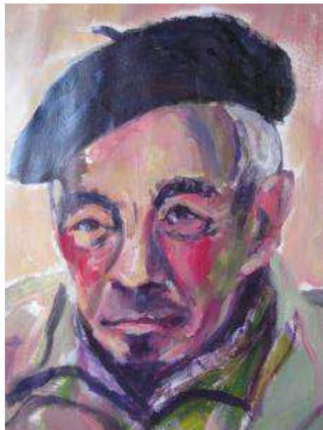
vu par Sylvie De Maeseneire