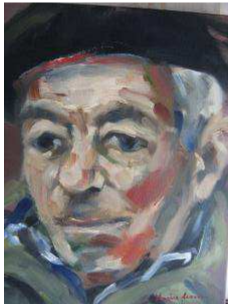
vu par Karine Lemoine