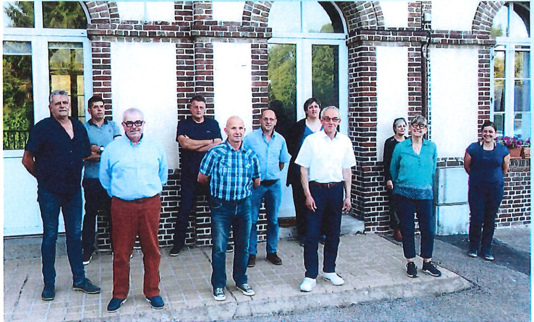
Le nouveau conseil municipal.